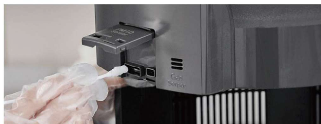
空氣品質感測器檢查