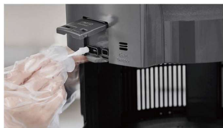
空氣品質感測器檢查