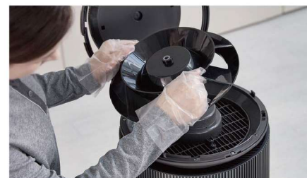
循環扇與內部清潔